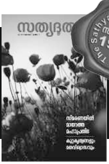
The Sathyadoothan Monthly