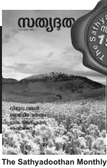
The Sathyadoothan Monthly