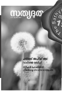
The Sathyadoothan Monthly