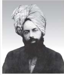
ഹദ്റത്ത് അഹ്മദ് (അ)