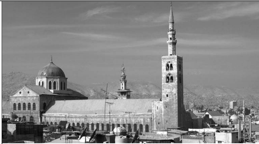
മുഖചിത്രം: ഈസാ നബി (അ)യുടെ ആഗമനമുണ്ടാകുമെന്ന് ബഹുഭൂരിപക്ഷം മുസ്ലീംകളും വിശ്വസിക്കുന്ന ഡമാസ്കസിലെ മിനാരം.

16 ക്രിസ്തു: ഒരു വിദ്യാർഥിയുടെ ചോദ്യങ്ങൾക്ക് ഹദ്ദിത്ത് അഹ്മദ് (അ) ന്റെ മറുപടി