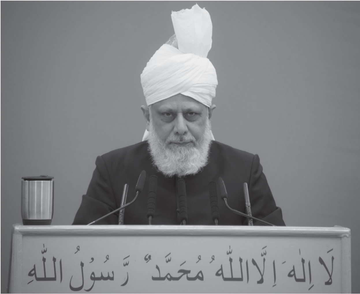
ഹദ്റത്ത് മിർസാ മസ്റൂർ അഹ്മദ് (അയ്യൂദഹു...)

ഹദ്റത്ത് സിനാനുബ്നു അബീ സിനാൻ എന്ന സ്വഹാബി ബദർ യുദ്ധമുഴപ്പുടെ നബി(സ) തി