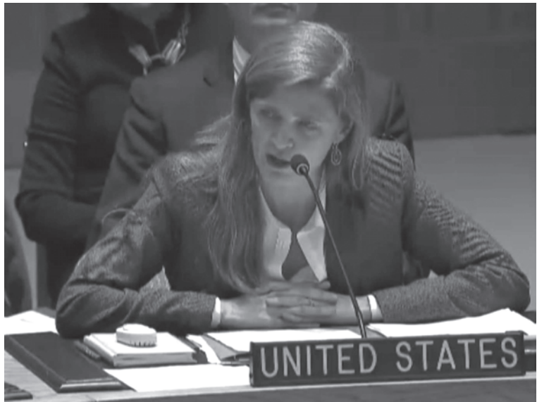
യു.എന്നിലെ യു.എസ് അംബാസഡർ സാമന്താ പവർ

ഫലസ്തീനിൽ നിന്നും, ഇസ്രായേൽ ആക്രമിച്ചു പിടിച്ചെടുത്ത സ്ഥലത്ത് പാർപ്പിട നിർമ്മാണം നിർത്തി വെക്കാൻ ആവശ്യപ്പെട്ടു കൊണ്ടുള്ള 2016 ഡിസംബർ 23 റാതീയതിയത്തെ യു.എൻ സെക്യൂരിറ്റി കൗൺസിൽ പ്രമേയം അമേരിക്കയുടെ യു.എൻ അംബാസഡർ സാമന്താ പവർ വീറ്റോ ചെയ്യാതെ, വിട്ടു നിൽക്കുകയുണ്ടായി. ന്യൂസിലന്റ്, സെനഗൽ, മലേഷ്യ, വെനിസ്വല എന്നീ രാജ്യങ്ങളുടെ അപേക്ഷ പ്രകാരമാണ് പ്രമേയം അവതരിപ്പിച്ചത്. അമേരിക്ക, റഷ്യ, ചൈന, ബ്രിട്ടൻ, ഫ്രാൻസ് എന്നീ വീറ്റോ പവറുള്ള സ്ഥിരാംഗങ്ങൾക്ക് പുറമേ അംഗോള, ഈജിപ്ത്, ജപ്പാൻ, മലേഷ്യ, ന്യൂസിലന്റ്, സ്പെയിൻ, ഉക്രെയിൻ, ഉറുഗ്വേ, സെനഗൽ, വെനിസ്വല എന്നിവയാണ് സെക്യൂരിറ്റി കൗൺസിലിലെ 15 അംഗരാജ്യങ്ങൾ. 1979 മുതൽ ഇസ്രായേലിനെതിരെയുള്ള എല്ലാ പ്രമേയങ്ങളെയും അമേരിക്ക വീറ്റോ ചെയ്യുകയായിരുന്നു പതിവ്. ദീർഘനാളായി ഇസ്രായേലിന്റെ എല്ലാ അതിക്രമങ്ങൾക്കും അധിനിവേശങ്ങൾക്കും കൂട്ടുനിന്ന അമേരിക്കയിൽ നിന്നുള്ള ഈ തിരിച്ചടി ഇസ്രായേലിന് വൻ ആഘാതമാണ് ഏൽപ്പിച്ചത്. പ്രമേയം വോട്ടി നിട്ടപ്പോൾ അമേരിക്ക വിട്ടുനിന്നു.