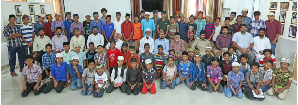
കേരളത്തിൽ നിന്നുള്ള കുട്ടികൾ പരിശുദ്ധ വാദിയാൻ സന്ദർശന വേളയിൽ