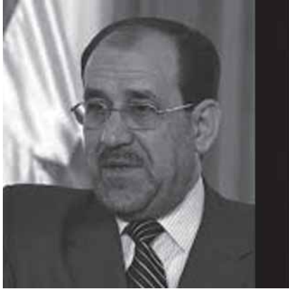
നൂറി അൽ മാലിക്കി

ഐ എസ് ഐ എസ് (ISIS) എന്ന ചുരുക്കപ്പേരിലറിയപ്പെടുന്ന സലഫി ഭീകര സംഘടനയാണ് ഇറാഖിലെ മാലിക്കി ഭരണകൂടത്തിനെതിരെ അക്രമാസക്തമായ സായുധ ജിഹാദ് നടത്തുന്നത്. ഒരു രാഷ്ട്ര സൈന്യത്തെ വെല്ലു നീക്കിയിട്ട് സുദാമിന്റെ ജന്മദേശമായ തിക്രിത്, പ്രമുഖ എണ്ണ നഗരമായ ബെയ്ജി മുതലായ വടക്കൻ ഇറാഖിലെ സിറിയൻ ഭാഗത്തുള്ള പട്ടണങ്ങൾ പിടിച്ചടക്കിക്കൊണ്ട് തലസ്ഥാനമായ ബാഗ്ദാദിന്റെ നേരെയെത്തി അവിടേക്ക് കുതിക്കുന്നത്. ശിയാ വിഭാഗക്കാരനും സൗദിയുടെ വിരോധിയും ഇറാൻ പിന്തുണയ്ക്കുന്ന ആളുമായ സിറിയയിലെ ബശ്ശാറുൽ അസ്സദിനെതിരെയുള്ള കലാപത്തിലും ISIS നിർണായക പങ്കാണ് വഹിക്കുന്നത്. സിറിയയിലുള്ള റക് നഗരമാണ് ആദ്യമായി ISIS കീഴടക്കിയത്. സൗദി അറേബ്യ, ഗൾഫ് നാടുകൾ, സുന്നി മുസ്ലിംകൾ ഭരിക്കുന്ന രാജ്യങ്ങൾ, സമ്പന്നരായ സുന്നികൾ മറ്റു ബാഹ്യശക്തികൾ മുതലായവരിൽ നിന്നും ഉദാരമായി ധന സഹായം ലഭിക്കുന്ന ISIS ലോകത്തിലെ ഏറ്റവും സമ്പന്നമായ ഭീകര സംഘടനയാണ്. കീഴടക്കിയ എണ്ണ പാടങ്ങളിൽ നിന്നും എണ്ണ വിറ്റു കിട്ടുന്ന വമ്പിച്ച വരുമാനവും വൻ നഗരങ്ങളിലെ ബാങ്കുകളിലെ നിക്ഷേപം കവർന്നെടുത്തതുമാണ് അവരുടെ സമ്പത്തിന് മുതൽ കൂട്ടുന്ന മറ്റു സ്രോതസ്സുകൾ. അമേരിക്കൻ സൈനിക യൂണിറ്റുകളിൽ പ്രത്യക്ഷപ്പെടുന്ന അവർക്ക് M60, M240 മുതലായ ആധുനിക രീതിയിലുള്ള മെഷീൻ ഗണ്ണുകൾ, ഗ്രനേഡ് ലോഞ്ചറുകൾ, ആന്റി എയർക്രാഫ്റ്റ് ഗൺ (വിമാനവേധക തോക്കുകൾ) മുതൽ സൈനിക വിമാനങ്ങൾ വരെ ഉണ്ട്. അവർക്ക് മുനിൽ ഇറാഖി സേന തോറ്റോടുകയാണ് എന്നാണ് പറയപ്പെടുന്നത്. സിറിയ