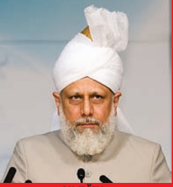
വുമ്പി: ഇമാമുസ്സമാന്റെ ആവശ്യകത