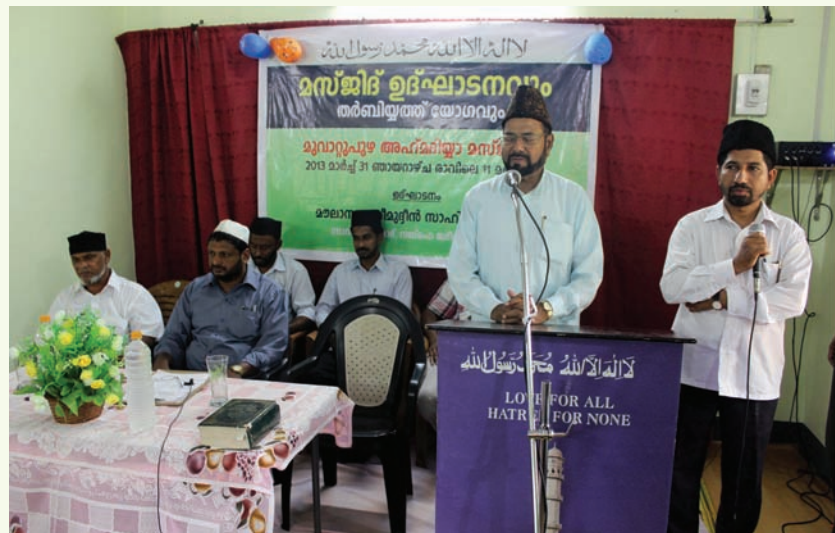
മുവാറ്റുപുഴയിൽ പുനർ നിർമിച്ച അഹ്മദിയ്യാ മസ്ജിദ് മൗലാന കരിമുദ്ദീൻ സാഹിബ് ഉദ്ഘാടനം ചെയ്യുന്നു.