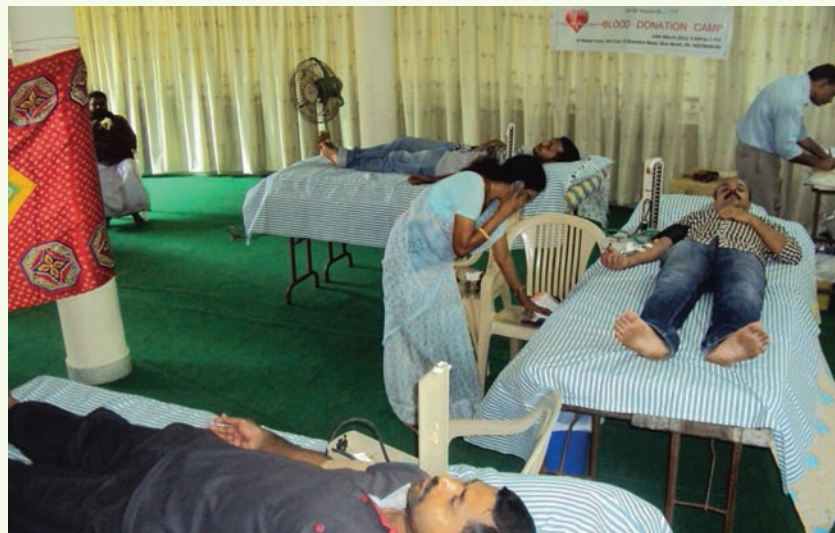
മജ്ലിസ് ഖുദാമുൽ അഹ്മദിയ്യാ സൗത്ത് കേരള ഐ. എം. എയുമായി സഹകരിച്ചുകൊണ്ട് മാർച്ച് 10-ാം തീയതി എറണാകുളം മസ്ജിദ് ഉമറിൽ സംഘടിപ്പിച്ച രക്ത ദാന ക്യാമ്പ്