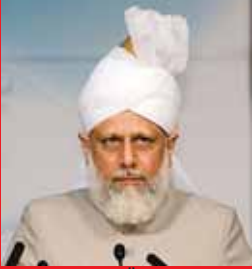
ബുദ്ധിമുട്ട്: തിരുവതൂറുടെ ഉത്കൃഷ്ട പദവി