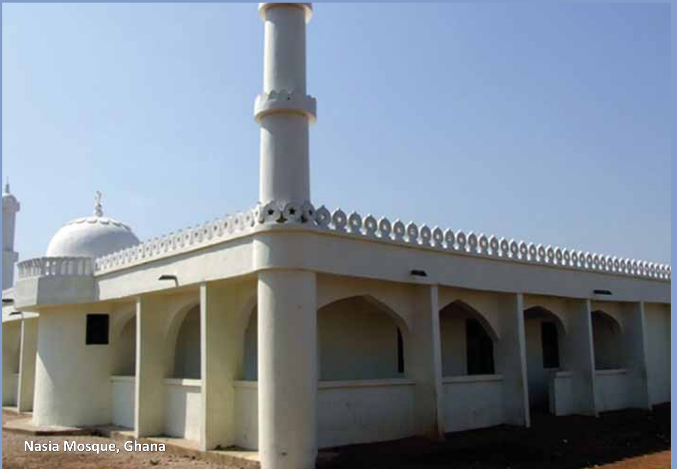
Nasia Mosque, Ghana