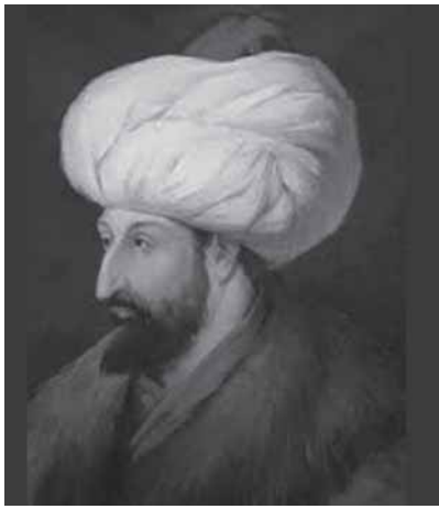
സുൽത്താൻ മുഹമ്മദ് ഫാതിഹ്

മുഹമ്മദ് രണ്ടാമന്റെ മരണശേഷം സുൽത്താൻ ബായസീദ് രണ്ടാമൻ