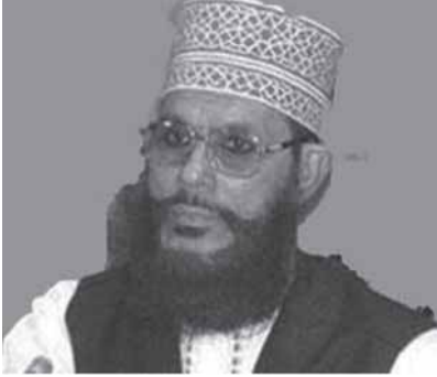
ദിൽവാർ ഹുസൈൻ സയീദ്

അവർ ഇപ്പോൾ ജയിലിലാണ്. നാൽപ്പത് വർഷങ്ങൾക്ക് ശേഷം 2013 ഫെബ്രുവരി 28 ന് ഇപ്പോഴത്തെ ബംഗ്ലാദേശ് ജമാഅത്തെ ഇസ്ലാമി നാഇബ് അമീർ വൈസ്പ്രസിഡന്റ്) ദിൽവാർ ഹുസൈൻ സയീദിയെ പ്രത്യേക വാർ ക്രിമിനൽ കോടതി വധശിക്ഷക്ക് വിധിച്ചിരിക്കുകയാണ്. ഇതിനേതുടർന്ന് ബംഗ്ലാദേശിൽ ജമാഅത്തെ ഇസ്ലാമി അഴിച്ചുവിട്ട കലാപത്തിൽ 50 ഓളം പേർ കൊല്ലപ്പെട്ടു.