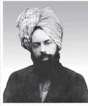
ഹദ്റത്ത് അഹ്മദ് (അ)