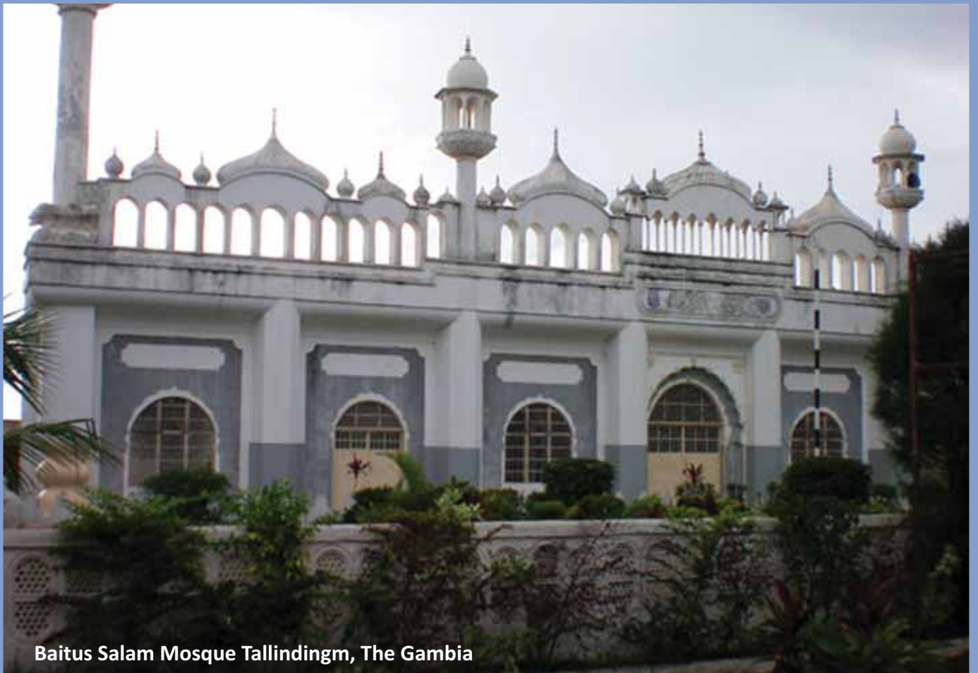
Baitus Salam Mosque Tallindingm, The Gambia