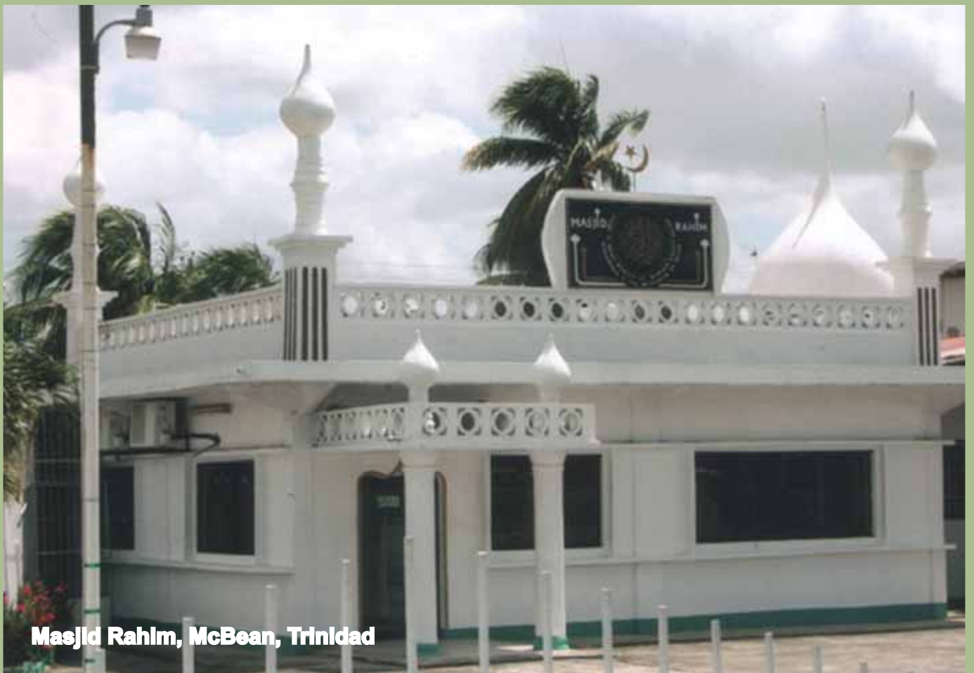
Masjid Rahim, McBean, Trinidad