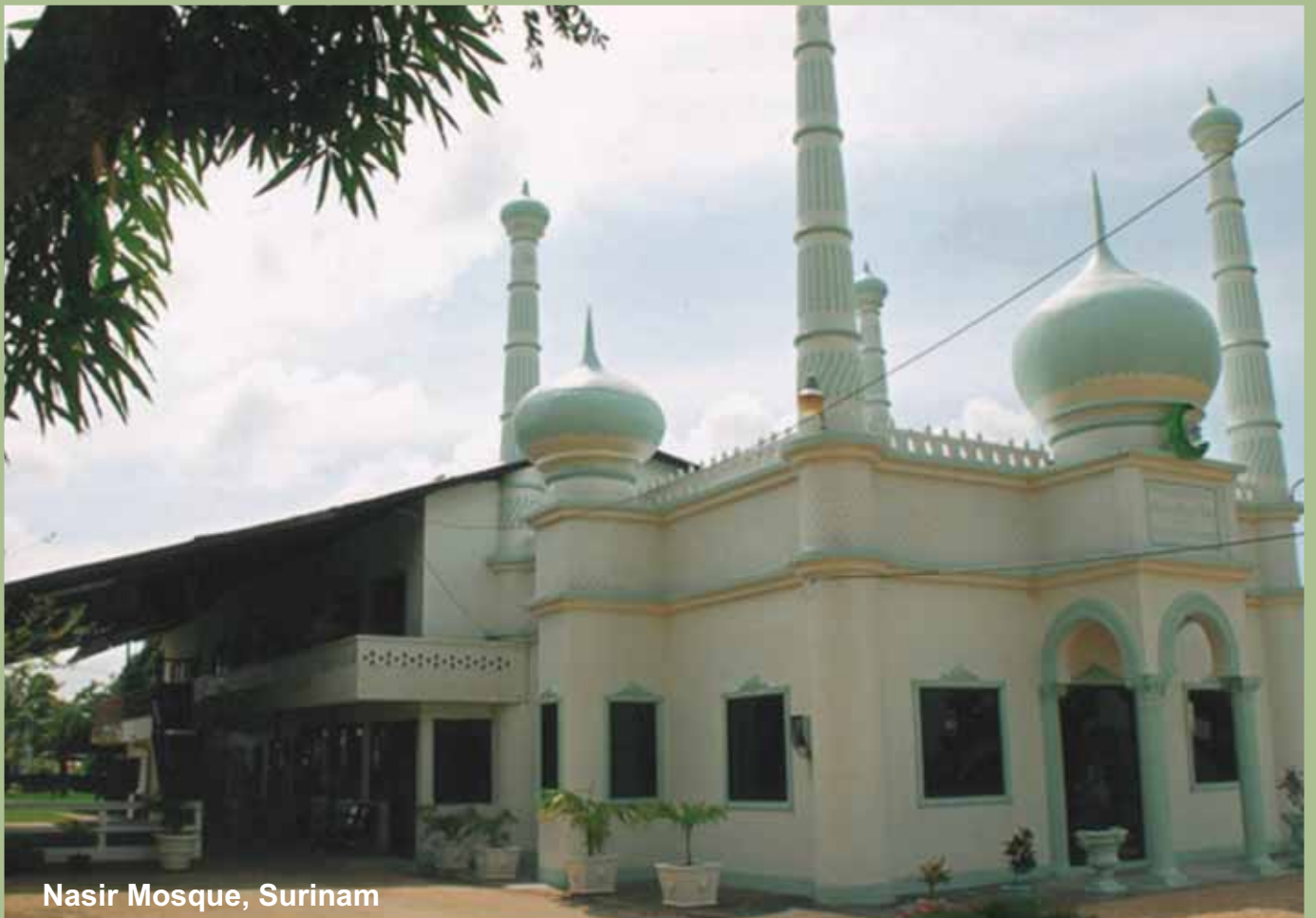
Nasir Mosque, Surinam