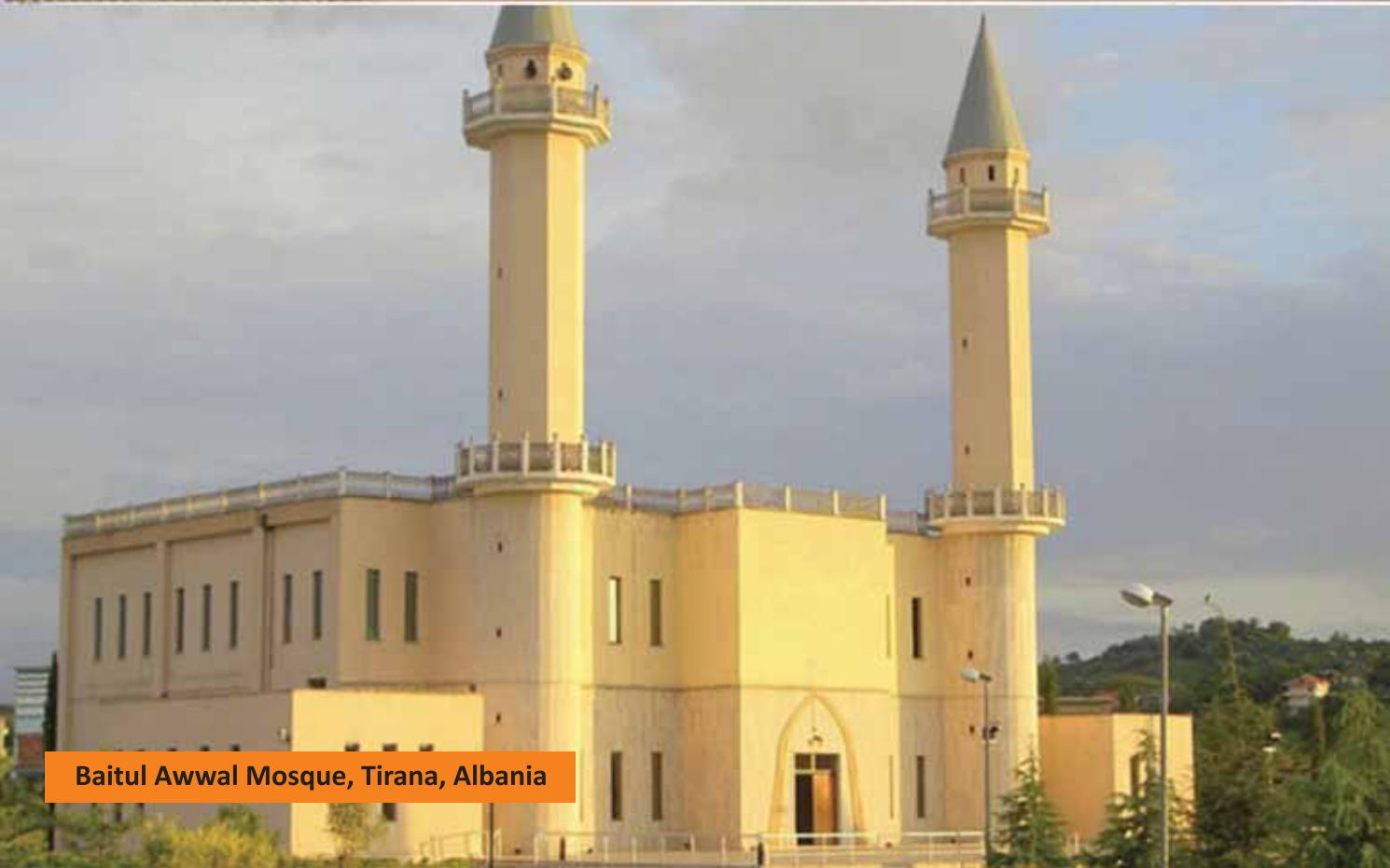
Baitul Awwal Mosque, Tirana, Albania