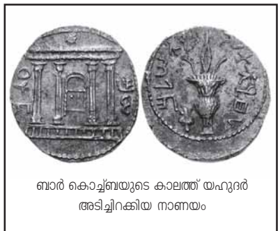
ബാർ കൊച്ചബയുടെ കാലത്ത് യഹൂദർ അടിച്ചറക്കിയ നാണയം

ഇതിന്റെ വർണനകൾ നാലു സുവിശേഷങ്ങളിലും കാണാം. യേശുവിന്റെ മുഖ്യപീഡകർ യഹൂദ പുരോഹിതന്മാരായിരുന്നു. അവർക്കെതിരെയുള്ള യേശുവിന്റെ ഭരണങ്ങൾ സുവിശേഷങ്ങളിൽ നിറഞ്ഞു നിൽക്കുന്നു. യഹൂദ മതനേതാക്കന്മാരേയും കപടനാട്യക്കാരായ പരീശരേയും ശാസ്ത്രിമാരേയും യേശു ശകാരിക്കുന്നത് നോക്കൂ. 'വേദജ്ഞരും ഫിസേയരും മോശയുടെ പീഠത്തിൽ ഇരിക്കുന്നു.... അവർ ചെയ്യുന്നത് നിങ്ങൾ പ്രമാണമാക്കരുത്. കാരണം അവർ പ്രസംഗിക്കുന്നത് അവർ ചെയ്യുന്നില്ല. അവർ ദുർവഹമായ ചുമട്ടുകൾ കെട്ടുന്നു. അവ മനുഷ്യരുടെ ചുമരിൽ വെക്കുന്നു. എന്നാൽ തങ്ങളുടെ വിരൽ കൊണ്ട് സഹായിക്കാൻ പോലും അവർ ഒരുകുമില്ല. അവർ ചെയ്യുന്നതെല്ലാം മനുഷ്യരെ കാണിക്കാൻ വേണ്ടിയാണ്. അവർ തിരുവചനങ്ങൾ എഴുതി നെറ്റിപ്പട്ടങ്ങൾക്ക് വീതികൂട്ടുന്നു. മേലുകിയിലെ തൊങ്ങലുകൾക്ക് വീതികൂട്ടുന്നു. അവർ വിരുന്നുകളിൽ മുഖ്യസ്ഥാനവും സിനഗോഗുകളിൽ ഏറ്റവും മികച്ച ഇരിപ്പിടവും ചന്തസ്ഥലങ്ങളിൽ അഭിവാദനവും മനുഷ്യരിൽ നിന്ന് ഗുരോ എന്ന സംബാധനയും മോഹിക്കുന്നു.' (മത്തായി 23:27) 3 യേശു ഒരിക്കൽ പറഞ്ഞു: ഞാൻ ദൈവത്തിൽ നിന്ന് വന്നവനാണ്. സ്വമേധയാ വന്നവനല്ല. അവൻ എന്നെ അയച്ചതാണ്. എന്തു കൊണ്ടാണ് ഞാൻ പറയുന്നത് നിങ്ങൾക്ക് (യഹൂദർക്ക്) മനസ്സിലാക്കാത്തത്. എന്റെ വാക്കുകൾ കേൾക്കാൻ നിങ്ങൾക്ക് കഴിയാത്തത് കൊണ്ട് തന്നെ. നിങ്ങൾ നിങ്ങളുടെ പിതാവായ പിശാചിൽ നിന്നുള്ളവരാണ്. നിങ്ങൾ നിങ്ങളുടെ പിതാവിന്റെ ആഗ്രഹങ്ങൾ നിറവേറ്റാനാ