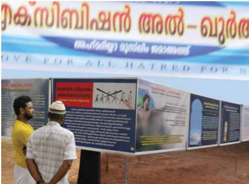
കണ്ണൂർ സിറ്റിയിൽ നടന്ന അൽഖുർആൻ എക്സിബിഷൻ