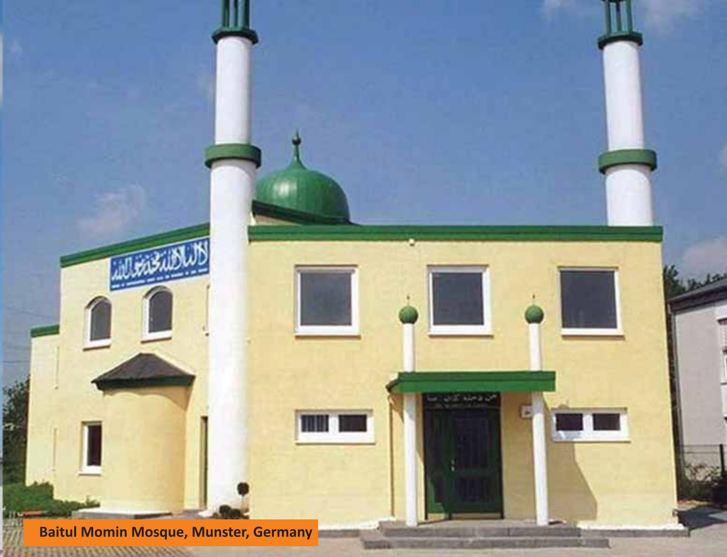
Baitul Momin Mosque, Munster, Germany