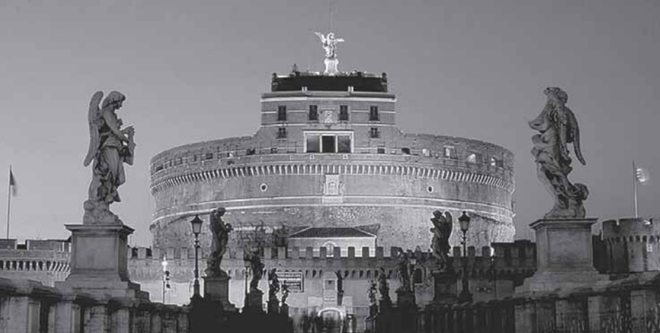
റോമിലെ ഹദ്രിയാൻ ചക്രവർത്തിയുടെ മുസോളിയം