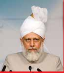
ബുതബ: വിജയത്തിന് ത്യാഗങ്ങൾ അനിവാര്യം