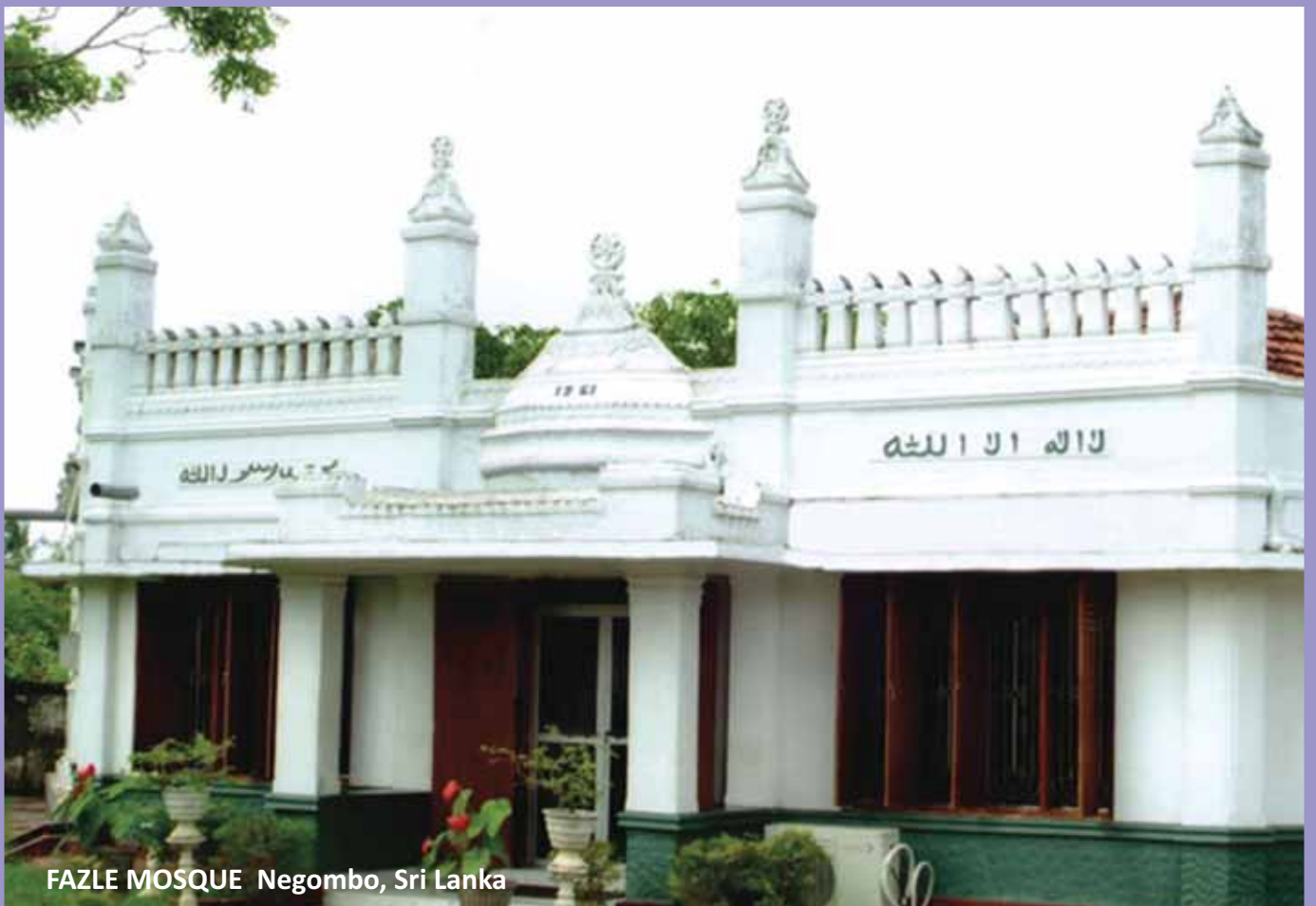
FAZLE MOSQUE Negombo, Sri Lanka