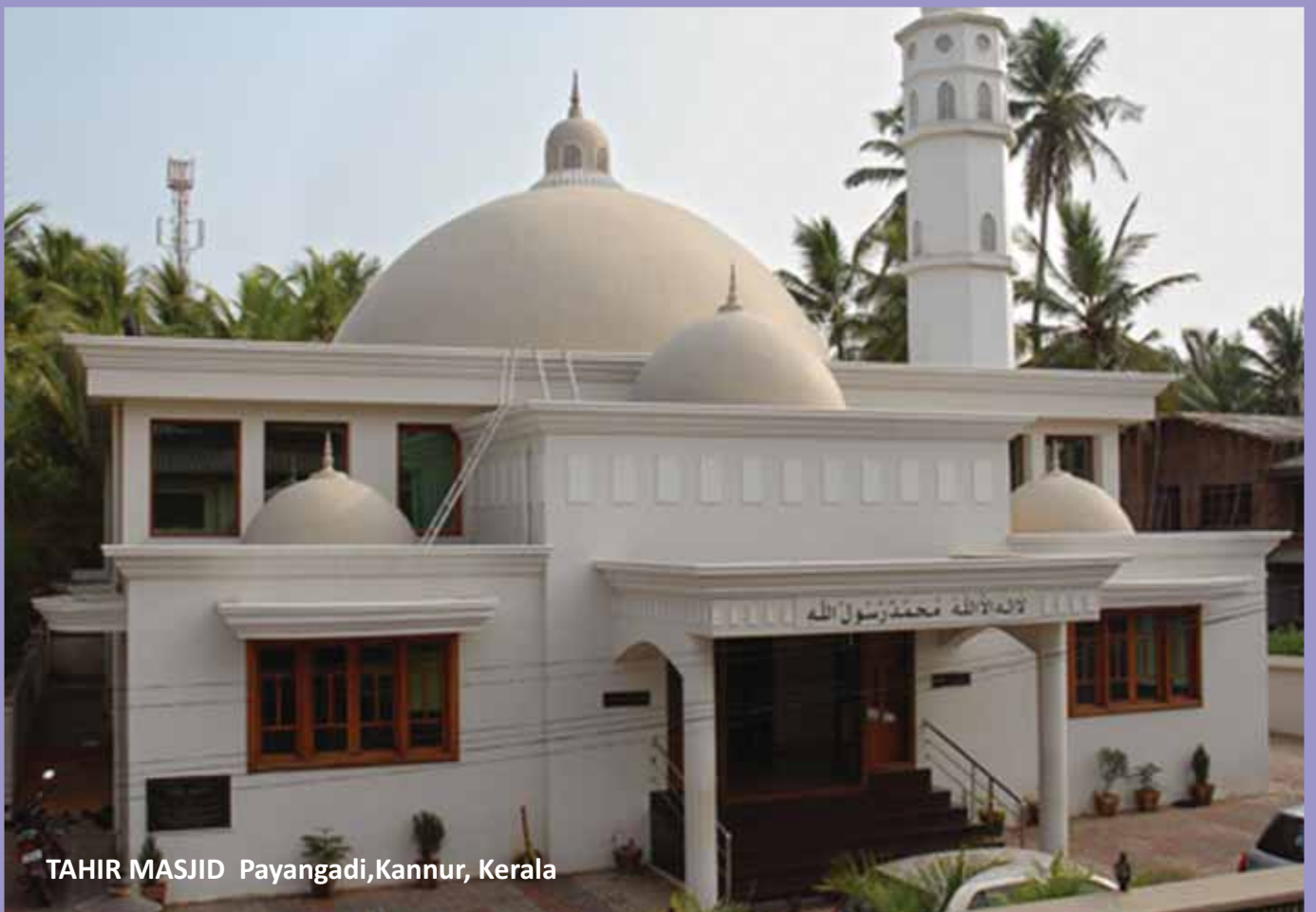
TAHIR MASJID Payangadi, Kannur, Kerala