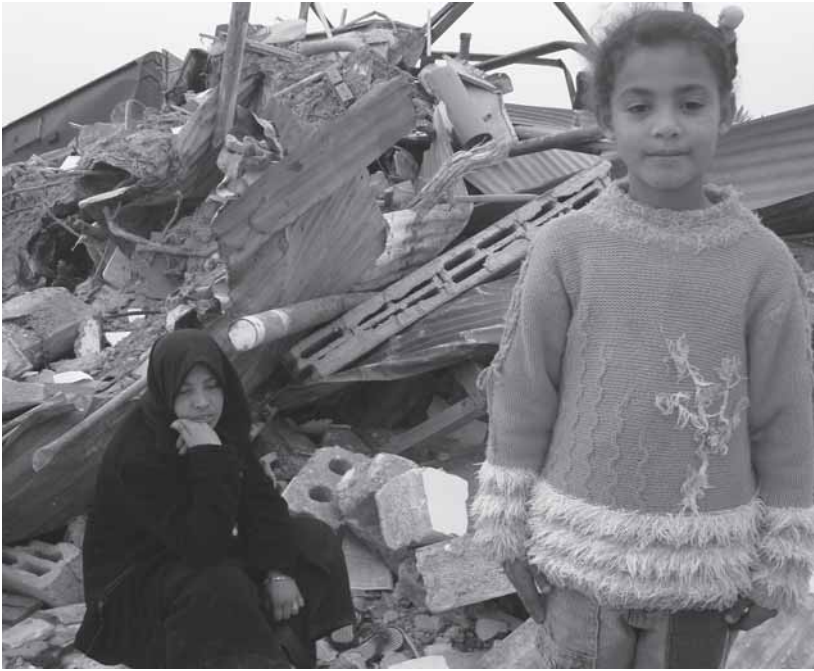
തകർക്കപ്പെട്ട ഒരു പലസ്തീൻ ഭവനം

പ്രകാരമാണ് പലസ്തീൻ നേതാവ് മഹ്മൂദ് അബ്ബാസ് ഐക്യരാഷ്ട്ര സഭയിൽ ഈ അഭ്യർത്ഥന നടത്തിയിരിക്കുന്നത്. എന്നിട്ടും ഇസ്രായേലും അമേരിക്കയും അതിനെ എതിർക്കുകയാണ്. പലസ്തീൻ ജനതയ്ക്ക് സ്വയം നിർണയാവകാശത്തിനും സ്വതന്ത്ര പരമാധികാര രാഷ്ട്രമാവാനുമുള്ള അധികാരം 1974 ൽ ഐക്യരാഷ്ട്ര സഭ അംഗീകരിച്ചതാണ്. 2009 ഡിസംബറിൽ അധിനിവിഷ്ട പലസ്തീന്റെ പരമാധികാരവും മറ്റൊരു പ്രമേയത്തിലൂടെ വ്യക്തമാക്കുകയും ചെയ്തിട്ടുണ്ട്. ഇസ്രായേൽ ഉൾപ്പെടെ 8 രാജ്യങ്ങൾ അതിനെ എതിർക്കുകയും ഏഴു രാജ്യങ്ങൾ വോട്ടെടുപ്പിൽ നിന്ന് വിട്ടുനിൽക്കുകയും ചെയ്തെങ്കിലും 165 രാജ്യങ്ങൾ പ്രമേയത്തെ പിന്തുണച്ചു. പലസ്തീനികൾക്ക് സ്വന്തമായി പാസ് പോർട്ടുണ്ട്. പലസ്തീനിയൻ അതോറിറ്റിയുടെ പേരിലുള്ള ഈ പാസ് പോർട്ട് ഒരു യാത്രാരേഖയായി അമേരിക്കയും ബ്രിട്ടനും ഉൾപ്പെടെ മുപ്പത് രാജ്യങ്ങളെങ്കിലും അംഗീകരിച്ചിട്ടുണ്ട്. പക്ഷേ സയണിസ്റ്റ് ലോബി അതിൽ നിന്ന് ഒരിഞ്ച് മുന്നോട്ട് പോകാൻ അമേരിക്കയെ അനുവദിക്കില്ല. ആഫ്രിക്കൻ രാജ്യമായ സുഡാന്റെ ക്രിസ്ത്യൻ ഭൂരിപക്ഷമുള്ള തെക്കൻ ഭാഗത്തെ വിഭജിച്ചുകൊണ്ട് ഒരു പുതിയ ക്രൈസ്തവ രാഷ്ട്രം ഏകദേശം രണ്ടര മാസം മുമ്പ് 2011 ജൂലായ് 14 ന് ഐക്യരാഷ്ട്ര സഭയുടെ അംഗീകാരത്തോടെ രൂപം