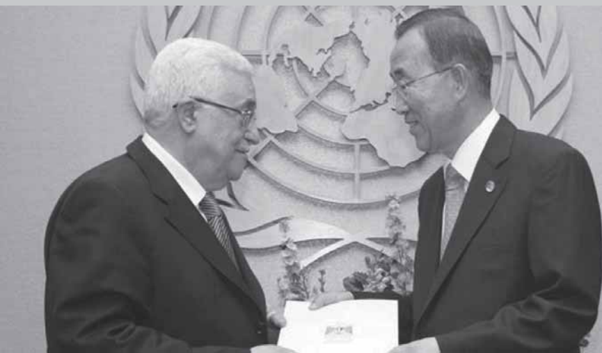
പലസ്തീൻ പ്രസിഡന്റ് മഹ്മൂദ് അബ്ബാസ് യുഎൻ സെക്രട്ടറി ജനറൽ ബാൻകി മുണിന് അംഗത്വ അപേക്ഷ നൽകുന്നു

സെപ്റ്റംബർ 23-ാം തീയതി പലസ്തീൻ പ്രസിഡന്റ് മഹ്മൂദ് അബ്ബാസ് തന്റെ രാജ്യത്തിന് പൂർണ്ണ രാഷ്ട്ര പദവി നൽകണമെന്ന് ആവശ്യപ്പെട്ട് നടത്തിയ ഹൃദയസ്പർശകമായ അഭ്യർത്ഥനയോട് 193 അംഗ രാജ്യങ്ങളുള്ള ഐക്യരാഷ്ട്രസഭയിൽ ഇന്ത്യയടക്കം 120 രാജ്യങ്ങൾ പലസ്തീനികൾക്ക് പിന്തുണ അറിയിച്ചിട്ടുണ്ട്. ഇപ്പോൾ പലസ്തീൻ ഐക്യരാഷ്ട്രസഭയിൽ നിരീക്ഷക പദവി മാത്രമേയുള്ളൂ. വോട്ടിങ്ങിൽ പങ്കെടുക്കാൻ