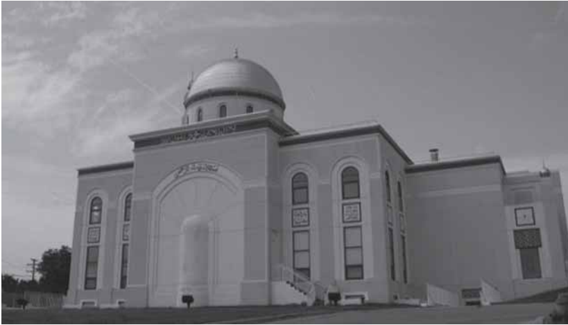
അമേരിക്കയിലെ അഹ്മദികൾ നിർമ്മിച്ച പള്ളി (ബൈത്തുർ റഹ്മാൻ വാഷിംഗ്ടൺ)

ചാരപ്രകാരം വളർത്താൻ പ്രത്യേകം ഊന്നൽ നൽകണമെന്നും കൂടാതെ ഏക ദൈവത്തെ ആരാധിക്കാൻ എല്ലാ പട്ടണങ്ങളിലും മസ്ജിദുകൾ പണിയണമെന്നും അദ്ദേഹം ഉപദേശിക്കുകയുണ്ടായി.