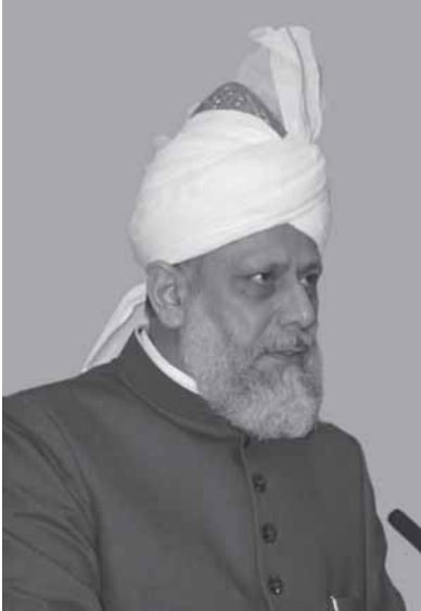
(9-09-2011 ന് ഖലീഫത്തുൽ മസീഹ് ബൈത്തുൽ ഫുതുഹിൽ (ലണ്ടൻ) വെച്ച് നിർവഹിച്ച ജുമുഅ ഖുത്ബയുടെ സംഗ്രഹം.)

സത്യസന്ധത എന്ന ഗുണം സ്വായത്തമാക്കാൻ മതങ്ങൾ മാത്രമല്ല പറയുന്നത്. മതവിശ്വാസമുള്ളവരും ഇല്ലാത്തവരുമായ ഓരോ വ്യക്തിയുടെയും പ്രകൃതം ഈ സർഗ്ഗം സ്വായത്തമാക്കണമെന്ന് പറയുന്നുണ്ട്. എന്നാൽ മനുഷ്യപ്രകൃതം ആഗ്രഹിക്കുന്ന ഈ സർഗ്ഗം അതർഹിക്കുംവിധം പ്രകടമാകുന്നില്ല എന്ന് പരിശോധനയിൽ നമുക്ക് വ്യക്തമാകുന്നതാണ്. തങ്ങളുടെ സ്വന്തം താൽപര്യങ്ങൾ സംരക്ഷിക്കുന്നതിന് പലരും കളവിയെയാണ് ആശ്രയിക്കുന്നത്. മനുഷ്യന്റെ വ്യക്തിജീവിതം മുതൽ ആഗോളതലത്തിലുള്ള ബന്ധങ്ങളിൽ വരെ സത്യസന്ധത എന്ന ഗുണം സ്വീകരിക്കേണ്ടതിനെക്കുറിച്ച് വളരെ ശക്തമായി പറയപ്പെടുന്നുണ്ടെങ്കിലും സന്ദർഭം വരുമ്പോൾ അതേ ശക്തിയിൽതന്നെ അതിനെ നിഷേധിക്കുകയും ചെയ്യുന്നു. തങ്ങളുടെ താൽപര്യ സംരക്ഷണത്തിനായി നിത്യജീവിതത്തിലുള്ള നിസ്സാരകാര്യങ്ങൾക്ക് വേണ്ടിപ്പോലും ജനങ്ങൾ അസത്യത്തെ ആശ്രയിക്കുന്നു. ഖാലെ സദീദ് എന്ന് പറയുന്ന യഥാർഥ സത്യസന്ധതയെ നിഷേധിക്കുകയാണ് ചെയ്യുന്നത്. വ്യാപാരങ്ങളിൽ ലോകത്തിലെ വലിയൊരു വിഭാഗം കളവിയെ കുട്ടുപിടിക്കുന്നു. സാമൂഹിക ബന്ധങ്ങളിലും പലപ്പോഴും കളവിയെ ആശ്രയിക്കുന്നു. നാട്ടിലെ രാഷ്ട്രീയപ്രവർത്തനത്തിൽ സത്യത്തിന്റെ കഴുത്ത് ഞെരുക്കിക്കളയുന്നു. ആഗോള രാഷ്ട്രീയരംഗവും ബന്ധങ്ങളും എല്ലാം അസത്യത്തെയാണ് കൂടുതലും അടിസ്ഥാനമാക്കുന്നത്. എത്രമാത്രമെന്നാൽ സത്യത്തെ മാത്രം പ്രചരിപ്പിക്കുന്ന മതങ്ങളിൽ പോലും തൽപര കക്ഷികൾ സത്യത്തെ തുണ്ടും തുണ്ടമാക്കിയിരിക്കുകയാണ്. സത്യത്തെ ഒരിക്കലും കാണാൻ പറ്റാത്ത രീതിയിൽ അതിനെ അവർ മൂടിക്കളയുന്നു. ചിലർ പറയുന്നത്, അസത്യത്തെ സത്യമാക്കി തോന്നിപ്പിക്കുന്നത്ര കളവു പറഞ്ഞുകൊണ്ടേ ഇരിക്കുക എന്നാണ്.