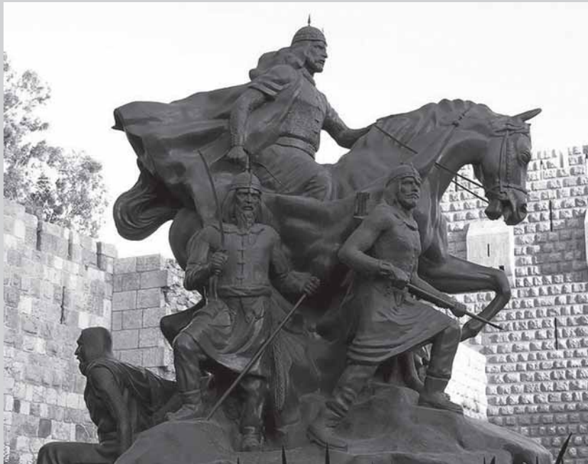
സലാഹുദ്ദീൻ അയ്യൂബിയുടെ ദമാസ്കസിൽ സ്ഥാപിച്ച പ്രതിമ

ക്രിസ്താബ്ദം 635ൽ ഖാലിദ് ബിൻവലീദ് ഡമാസ്കസിൽ എത്തിയപ്പോൾ മുസ്ലിംകൾ കീഴടക്കുന്ന അമുസ്ലിം പ്രജകളോട് അനുവർത്തിക്കേണ്ട നയത്തിന്റെ കീഴടക്കം ഉണ്ടാക്കിയിരുന്നു. ഉദാഹരണമായി ഡമാസ്കസിലെ അമുസ്ലിംകൾക്ക് (അവരിൽ അധികവും ക്രിസ്ത്യാനികളും ജൂതന്മാരും