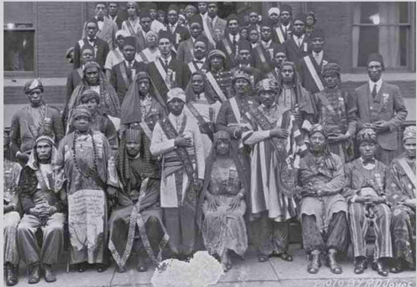
അമേരിക്കയിലെ ആദ്യകാല മുസ്‌ലിംകൾ

പതിനഞ്ചാം നൂറ്റാണ്ടു മുതൽ വടക്കെ അമേരിക്കയിൽ മുസ്‌ലിംകളുടെ ചെറു ഗ്രൂപ്പുകൾ എത്തിത്തുടങ്ങിയിരുന്നു. 16-ാം നൂറ്റാണ്ടു തൊട്ട് 2 മുതൽ 3 വരെ ദശലക്ഷം മുസ്‌ലിംകളെ ആഫ്രിക്കയിൽ നിന്ന് അടിമകളായി അമേരിക്കയിലേക്ക് കൊണ്ടുവന്നു. അവരിൽ മിക്കപേരും ട്രേഡിംഗ് കമ്പനികളുടെയും തുടർന്നുള്ള തലമുറയുടേയും മുസ്‌ലിം ഐഡന്റിറ്റി നഷ്ടപ്പെടുകയായിരുന്നു. അവരെല്ലാം ക്രമേണ ക്രിസ്തുമതത്തിലേക്ക് പരിവർത്തനം ചെയ്തു. എന്നിരുന്നാലും 19-ാം നൂറ്റാണ്ടിന്റെ മദ്ധ്യത്തോടെ യൂറോപ്പിൽ നിന്നും മദ്ധ്യ പൗരസ്ത്യ രാജ്യങ്ങളിൽ നിന്നും മുസ്‌ലിംകൾ അമേരിക്കയിലേക്ക് കുടിയേറാൻ ആരംഭിച്ചു. 1920 ൽ അഹ്മദ് മിഷനറി ഹദ്റത്ത്