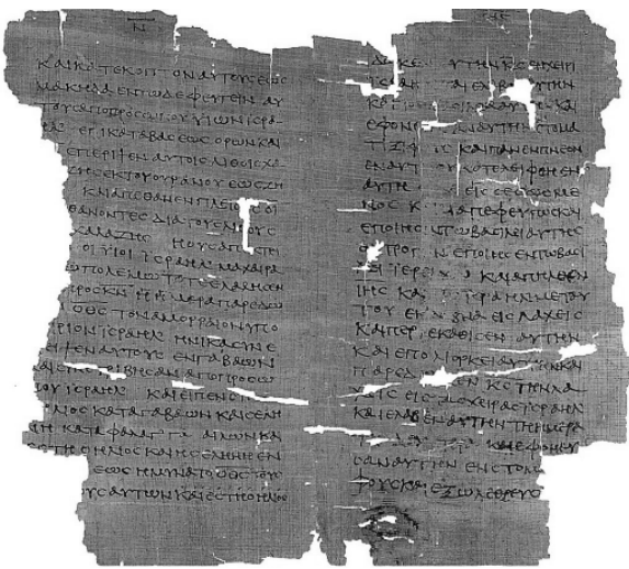
ചാവുകടൽ ചുരുളുകളിലെ ലിഖിതം

നിർഭാഗ്യകരമെന്ന് പറയട്ടെ, ആ അമൂല്യ ചരിത്രരേഖകൾ ക്രിസ്തുവിനികളുടേയും യഹൂദികളേയും അധീനത്തിലാണുള്ളത്. ഉള്ളടക്കം അവരുടെ താൽപര്യങ്ങൾക്ക് വിരുദ്ധമായത് കൊണ്ടാകാം. ചാവുകടൽ ചുരുളുകളിലെ ലിഖിതങ്ങൾ വളരെ