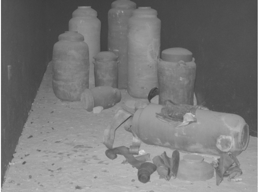
ചുരുളുകൾ സൂക്ഷിച്ച ജാറുകൾ

മറ്റു വിവരങ്ങൾ ഇപ്രകാരമാണ്. അവരുടെ ജീവിതവിശുദ്ധി മൂലം ആണ് ഈ പേര് ലഭിച്ചത്. ഏകദൈവത്തെ ആരാധിച്ചിരുന്നു. വെള്ള വസ്ത്രമായിരുന്നു അവർ ധരിച്ചിരുന്നത്. മൃഗബലി അർപ്പിച്ചിരുന്നു. നഗരങ്ങളിൽ നിന്ന് അകന്നു ജീവിച്ചു, കർഷകവൃത്തിയിലും മറ്റും ഏർപ്പെട്ടിരുന്നു. എങ്കിലും