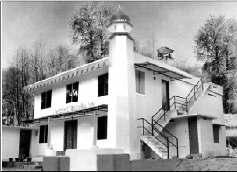
അലനല്ലൂരിൽ ഉദ്ഘാടനം ചെയ്യപ്പെട്ട പള്ളി