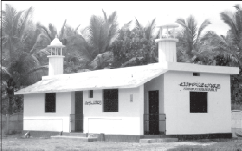
അഹ്മദിയ്യാ മുസ്ലിം ജമാഅത്ത് എടപ്പാളിൽ നിർമ്മിച്ച മസ്ജിദ്

ഹദ്ദിത്ത് ആയിശ (റ) റിവായത്ത് ചെയ്യുന്നു. “അല്ലാഹുവിന്റെ പേരിൽ സത്യം, റസൂലുല്ലായുടെ ദേഹം ആസ്ഥലത്ത് ഇല്ലാതായിട്ടില്ല. തിരുമേനിയുടെ ആത്മാവാണ് കരേറ്റപ്പെട്ടത്”. (അതായത് മിഅ്റാജ് ആത്മീയ ദർശനമായിരുന്നു. തഹ്സീർ കശ്ശാഫ്). ആയിശ (റ) ഇപ്രകാരവും റിവായത്ത് ചെയ്യുന്നു: ‘അതു അല്ലാഹുവിൽ നിന്നുള്ള സത്യമായ ഒരു ആത്മീയ ദർശനമായിരുന്നു’ (അദ്ദുറമുൽ മൻസൂർ). ഹദ്ദിത്ത് മുആവിയ ഇപ്രകാരം റിവായത്ത് ചെയ്യുന്നു. ‘അതു അല്ലാഹുവിൽ നിന്നുള്ള സത്യമായ ഒരാത്മീയ ദർശനമായിരുന്നു. (അദ്ദുറമുൽ മൻസൂർ) (തുടരും)