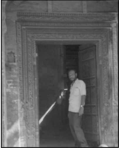
ഹസ്റത്ത് അഹ്മദ് (അ) ഹോശിയാർപുരിൽ ധ്യാനമിരുന്ന കെട്ടിടത്തിന്റെ പ്രധാന കവാടം

ആകാശത്തിലേക്ക് ഉയർന്നു നിൽക്കുന്ന ഖാദിയാനിലെ വെളുത്ത മിനാരം ആത്മീയഗരിമയുടെ വൈജയന്തിയാണ്. ഖാദിയാന്റെ ആത്മീയ പരിസരം അഹ്മദികൾക്ക് പ്രലോഭനമാണ്. ഭൗതിക നൊമ്പരങ്ങൾക്ക് ആത്മീയാശ്വാസം നൽകുന്ന ഖാദിയാന്റെ കല്ലിലും മണ്ണിലും അലിഞ്ഞുചേരൽ ലോകം മുഴുവനുമുള്ള അഹ്മദികളുടെ അദമ്യമായ ആഗ്രഹമാണ്. ഖാദിയാൻ ബിയാസ് നദീതീരം വരെ വ്യാപിക്കുമെന്ന് മസീദ് മൗഊദ്(അ)ൻ അല്ലാഹു വാഗ്ദാനം നൽകി. ഭാവിയിൽ സാഭവിക്കാനിരിക്കുന്ന ഈ പ്രവചനം മുൻകൂട്ടി കണ്ടുകൊണ്ടാണ് പലരും ഈ ആത്മീയ കേന്ദ്രത്തിൽ ഇടം