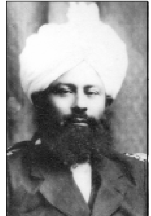
വാഗ്ദത്ത പരിഷ്കർത്താവ് ഹസ്സാത് മിർസാ ബശീറുദ്ദീൻ അഹ്മദ് (റ)

ഹസ്സാത് അഹ്മദ് (അ)ന് പ്രഭാവശാലിയായ ഒരു പുത്രനെ സംബന്ധിച്ച് ദൈവത്തിൽനിന്ന് ഒരു സുവിശേഷം ലഭിച്ചു. ഹസ്സാത് മിർസാ ബശീറുദ്ദീൻ മഹ്മൂദ് അഹ്മദിന്റെ ജീവിതം അക്ഷരത്തിലും അർത്ഥത്തിലും ആ സുവിശേഷത്തിന്റെ ഉജ്ജ്വലമായ സാക്ഷാത്കാരമായിരുന്നു