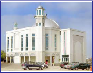
Baitul Futuh, London