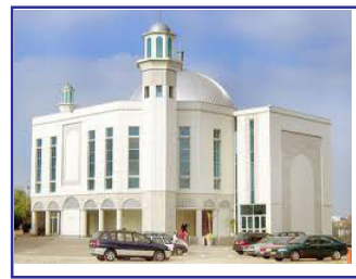
Baitul Futuh, London