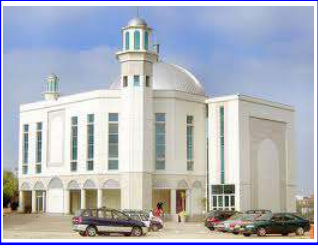
Baitul Futuh, London