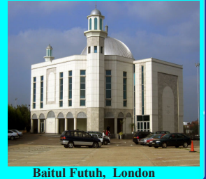
Baitul Futuh, London