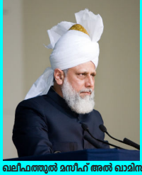
ഖലീഫത്തുൽ മസീഹ് അൽ ഖാമിസ്